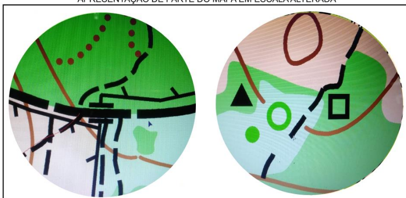
ÁREA DE COMPETIÇÃO APRESENTAÇÃO DE PARTE DO MAPA EM ESCALA ALTERADA

A hidrografia da área é composta por um açude e alguns poços intransponíveis isolados. Um rio sazonal (304) contorna o terreno à Norte e à Nordeste.